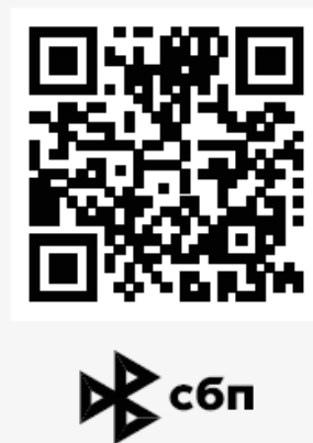
Вариант 2. Расположение логотипа под QR-кодом